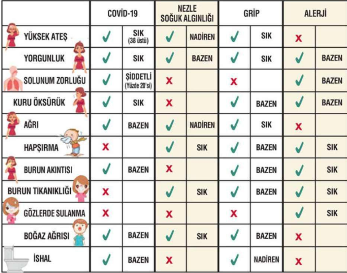
Şekil 1. Covid-19, Nezle, Grip ve alerji belirtileri